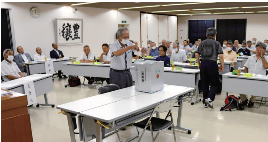
【第187回総代会の様子】