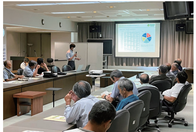
【北海道農業研究センター本所の様子】