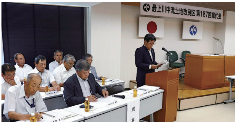
【第187回総代会の様子】

（員外理事）の選任」において、女性理事の登用を提案させて頂きますが、何卒ご理解いただきますようお願い申し上げます。 我々、土地改良区が果たさなければならぬ役割、そして、それらに課せられる課題は益々大きくなりますが、組合員の皆様のご理解とご協力をいただきながら将来に向けた運営を目指していかねければと思っております。 結びに、皆様方のますますのご健勝、ご活躍を心から祈念いたします。私の挨拶とさせていただきます。