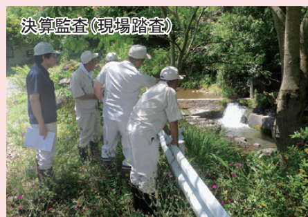
決算監査(現場踏査)