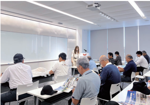
【ヤンマーアグリソリューションセンターの様子】

山形県ならではの農業に関する圃場環境や、農道・水路の管理方法を検討及び導入していく際の参考になる研修になりました。