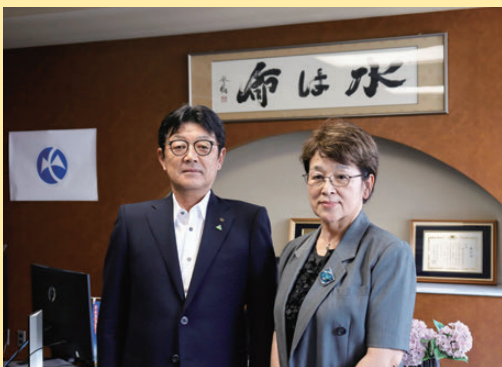
【大築理事長と堀野理事】