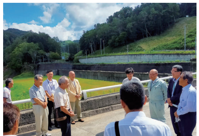
【厚真ダムにて現地視察】