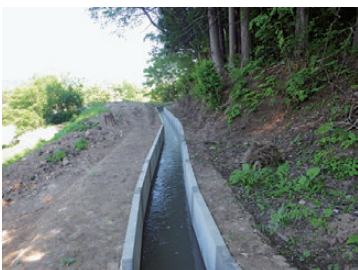
【防災減災事業谷柏新堰（本線水路）】