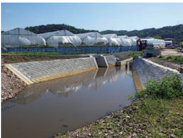
【防災減災事業（花川に設けられた新たな放流口）】

大明神堰は、南山形地区では命の水と言われていますが、石積みみの堰が約千メートル残り、改修が急務となっております。大切な水源を維持管理して参りますので、今後も組合員皆様のご理解とご協力をよろしくお願ひ申し上げます。