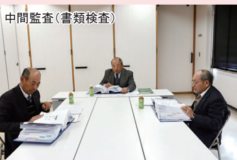
中間監査(書類検査)